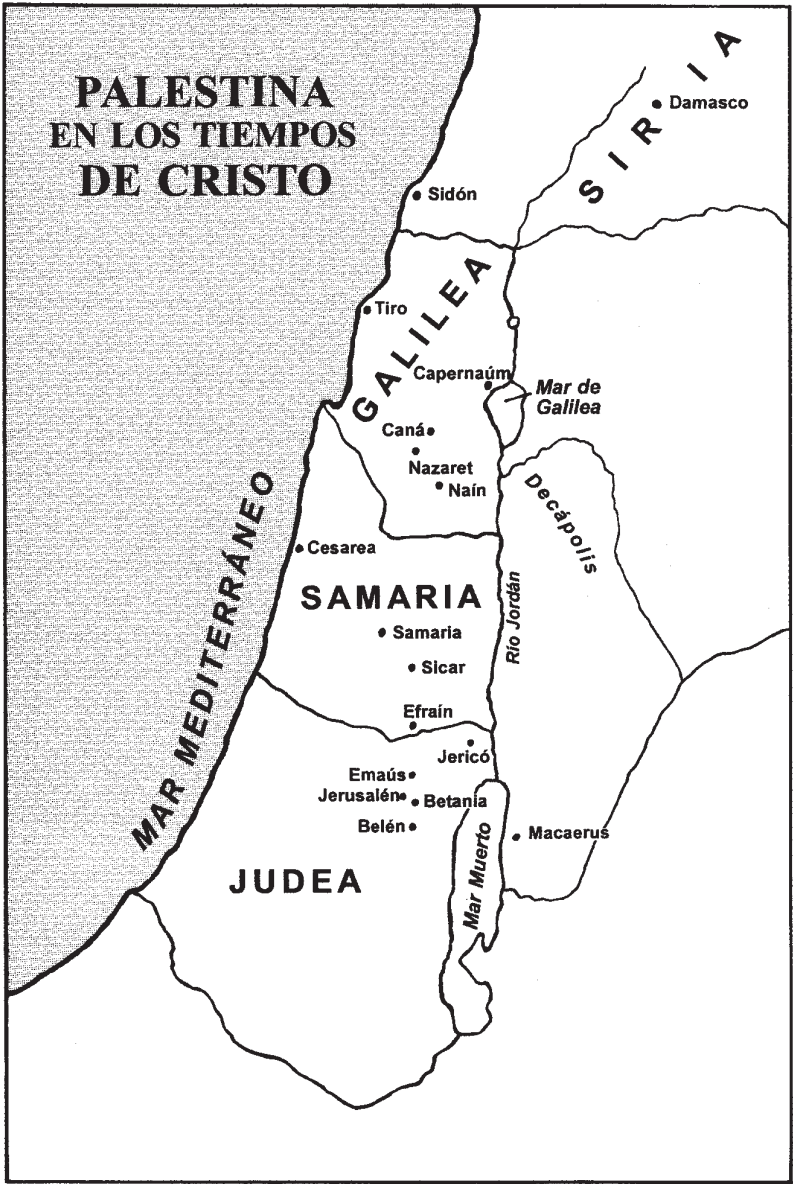
Palestina en los tiempos de Cristo