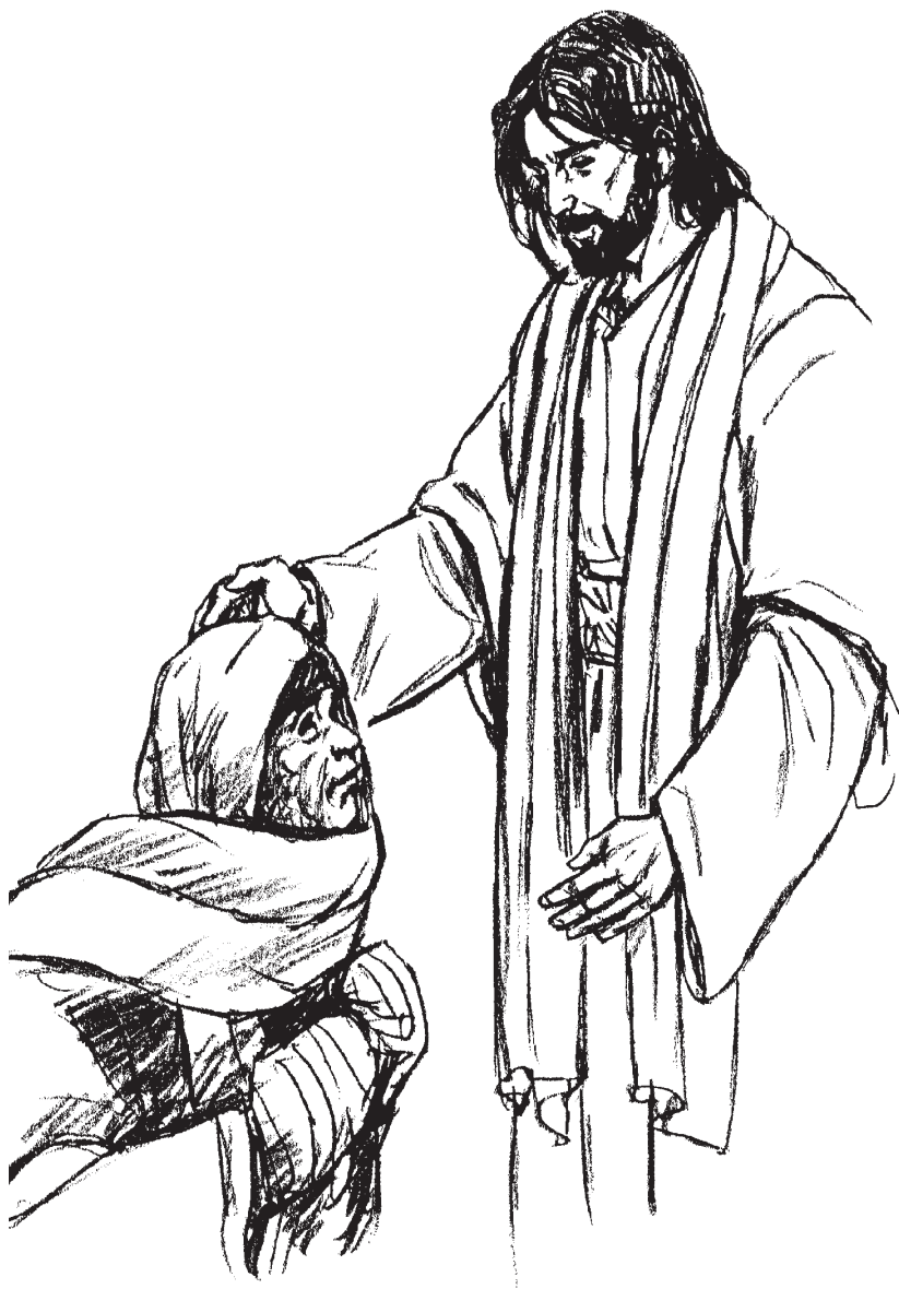
Jesús sana a un leproso