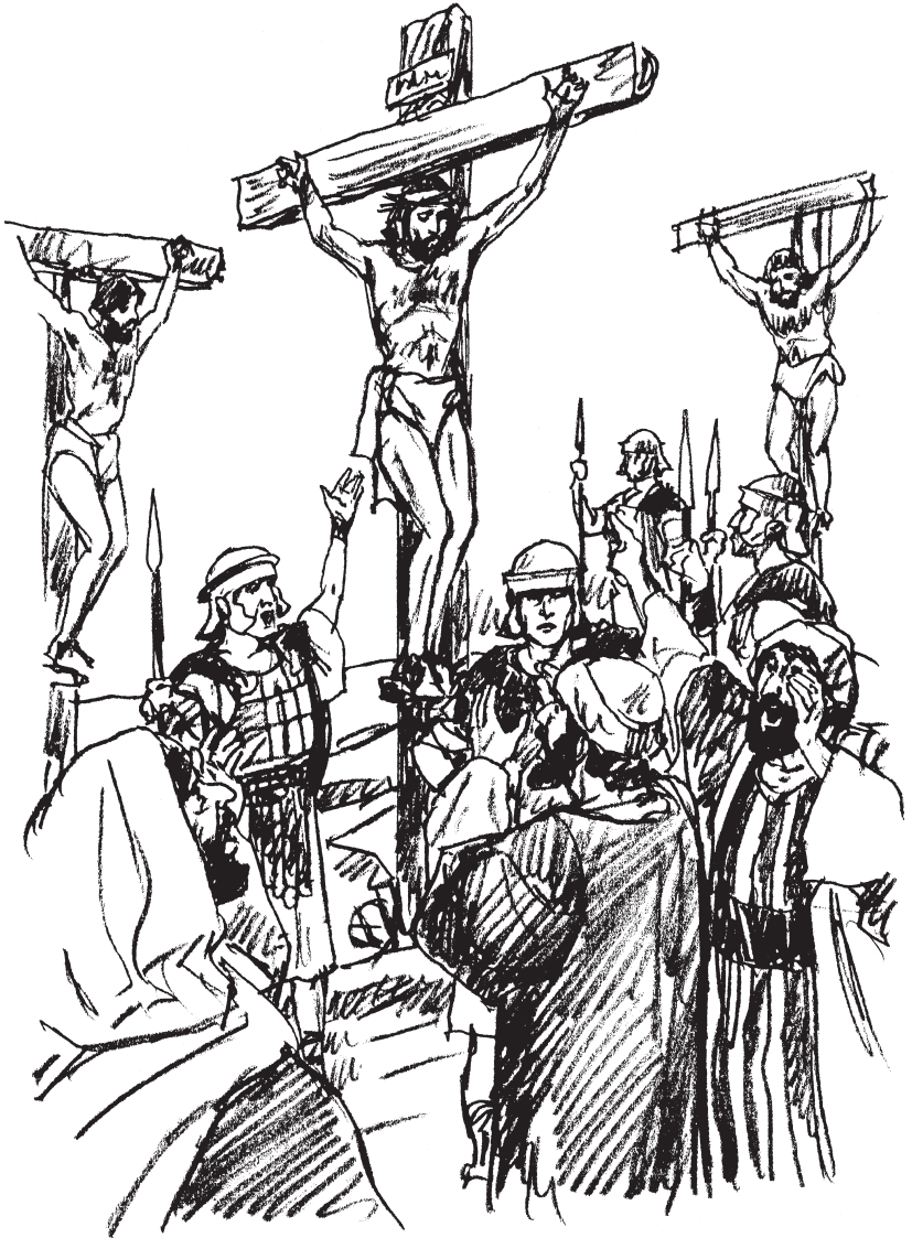
El alzamiento de la cruz