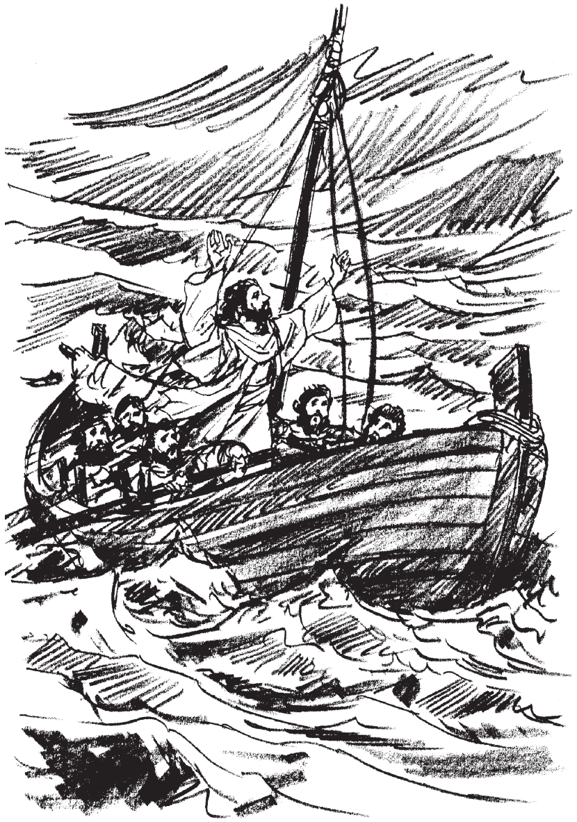
Jesús calma la tempestad