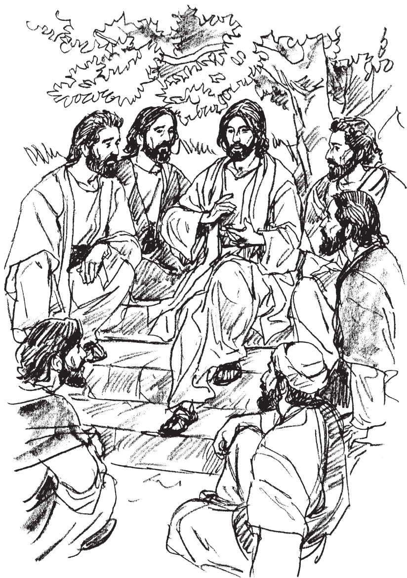
Jesús enseñando a sus discípulos