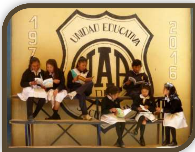
Juana Azurduy de Padilla – December 2019

De begrotingen en financiële jaarverslagen van onze stichting vindt u op onze website: www.ayni.nl/jaarverslagen .