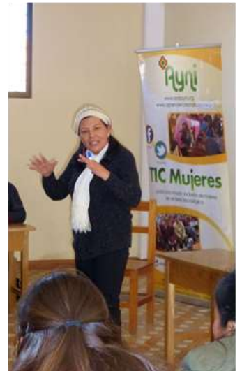
Workshop leermethode 'Marlene' met docenten