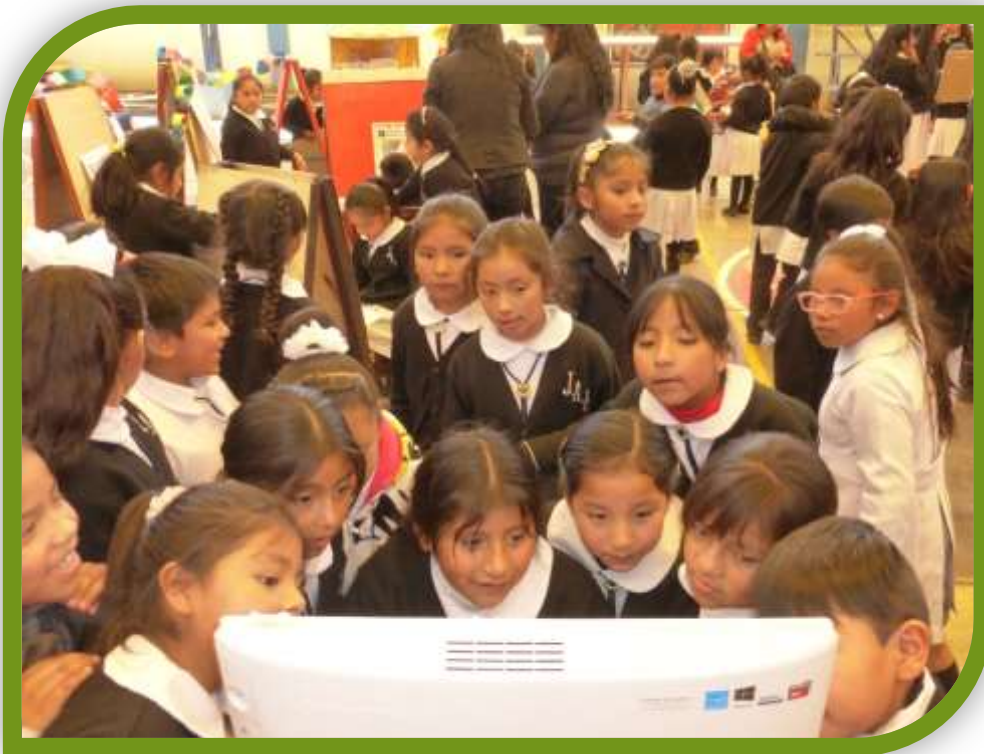
Juana Azurduy de Padilla – December 2019