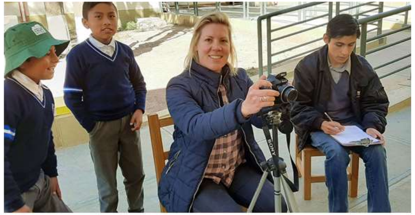
"The making off" en uitreiking van de bibliotheekpassen