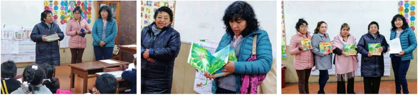
Uitreiking lesmateriaal en leesboeken school 1 Juana Azurduy de Padilla