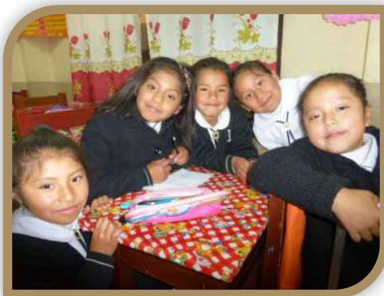
Juana Azurduy de Padilla – augustus 2019