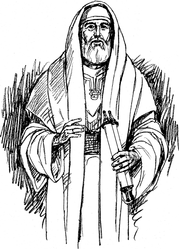
El profeta Isaías