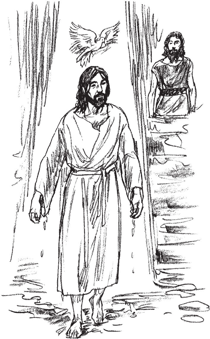
Jesús es ungido con el Espíritu Santo en su bautismo