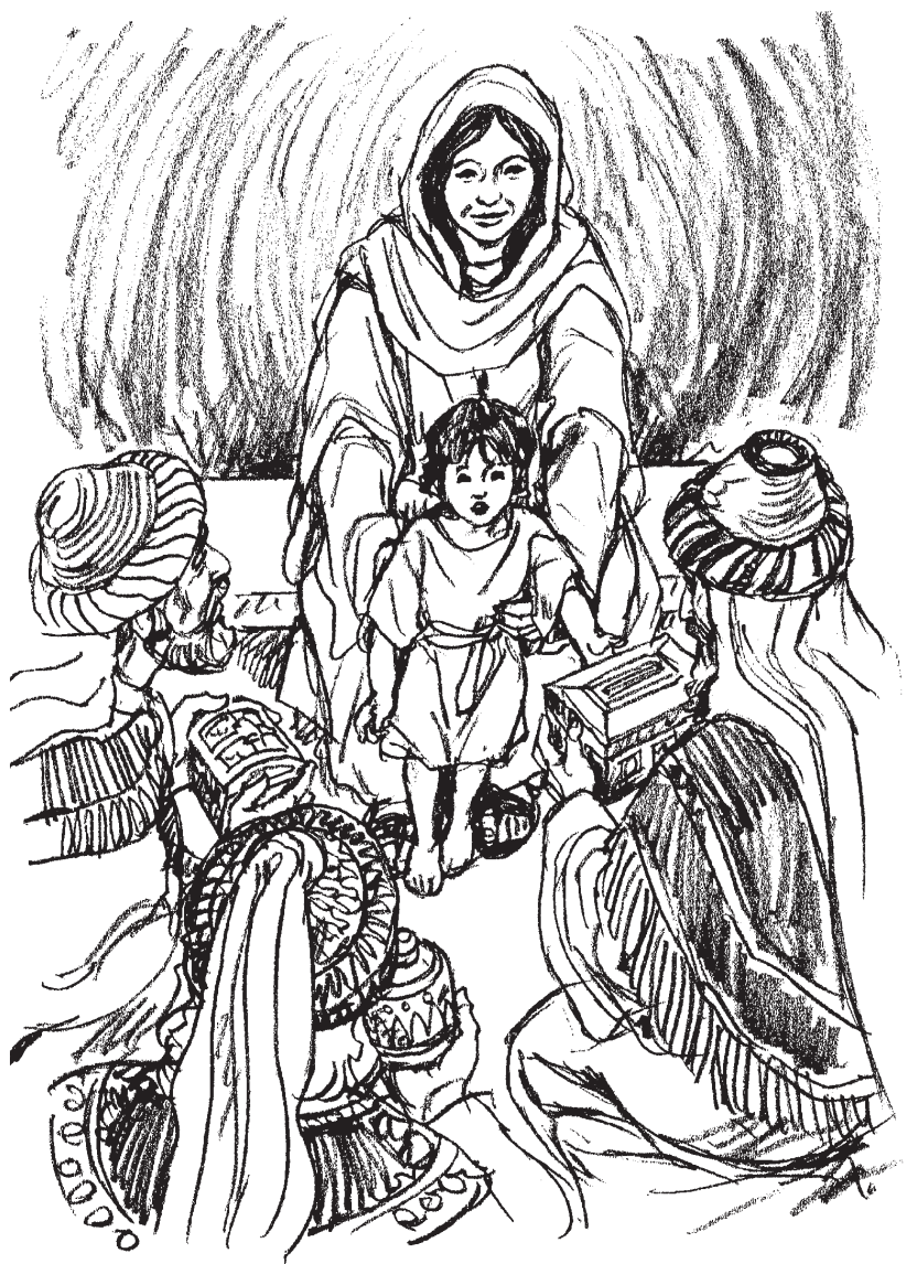
Los reyes magos adoran al niño Jesús