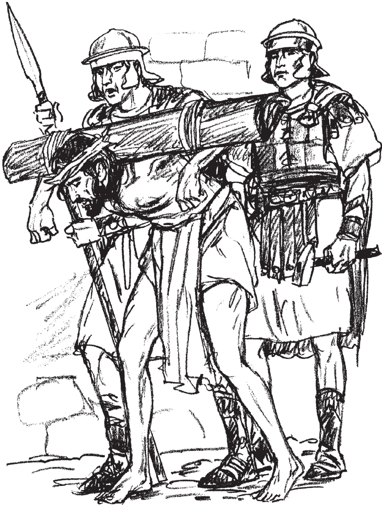
Jesús carga su cruz hacia el Calvario