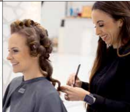
Hair & Make-up beautiful-by-minnie.ch