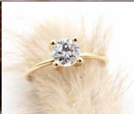
Verlobungsring „Princess“ goldschmiede-nikola.com