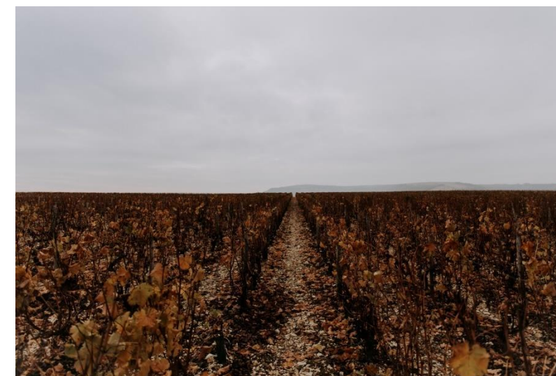
Wijngaard Domaine Carrou de Roger in de Sancerre

Pedroncelli Sonoma county Californië USA Zinfandel 44,00 Villa Girardi Valpolicella Ripasso Bure Alto It. Corvina e.a. 47,00 LFE 900 single Vineyard 2014 Chili Syrah 48,50 Novi 2015 Grès de Montpellier Frank. Grenache & Syrah 50,00