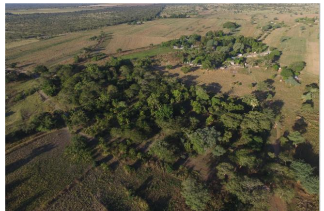
Drone foto van mei 2019

Foto google maps (Klik op de link en vlieg er zelf naartoe)