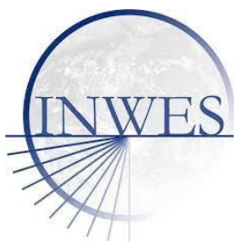
International Network Of Women Engineers and Scientists (UK)

Dit jaar (2021) ging COVID helaas onverminderd hard verder en vanwege dit scenario werd ons werk aangepast om de trainingen aan te bieden op een veilige manier voor de deelnemers, maar ook om het Ayni-personeel te beschermen. Onze organisatie is lid van drie belangrijke netwerken en heeft financiële steun van verschillende donoren voor de uitvoering van programma's en projecten gekregen en is daar zeer dankbaar voor!