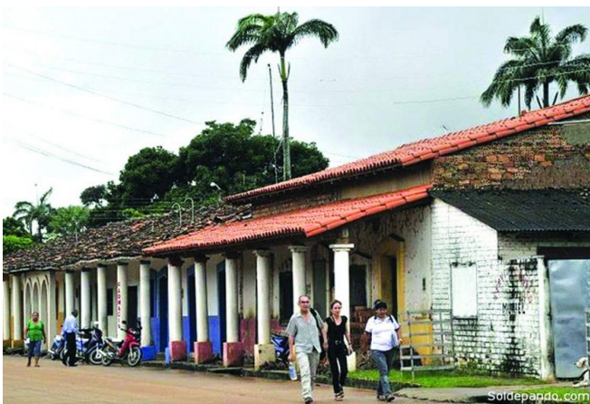
Santa Ana de Yacuma, Beni -Bolivia.

"Toen ik hoorde over het Jasaye-project raakte ik geïnteresseerd. Ik ben een computertechicus en ik werk op de school van CNL. Daarnaast werk ik op de school German Bush als administratief medewerker. Ik ben een alleenstaande vader voor mijn neefjes/nichtjes (met een trieste glimlach) Ik zou niet willen dat iemand de moeilijke tijden meemaakt die mijn familie heeft doorgemaakt. Mijn zus is overleden en liet 8 kinderen wees want de vader is niet in zicht. Ik ondersteun ze zodat ze vooruit kunnen komen en niet op het slechte pad terechtkomen, daarom wijd ik me aan studie en werk. Door de Ayni-cursussen te volgen, leerde ik meer over de interne onderdelen van de computer. Ik heb een kleine computerreparatiewerkplaats in mijn huis. In Santa Rosa zijn geen technici en daarom worden computers die gerepareerd moeten worden naar mij gebracht. Ik kende de interne onderdelen al en nu weet ik dankzij de cursus meer over software en zou ik graag meer willen leren over computer crashes en robotica. Met deze kennis, kan ik makkelijker een inkomen