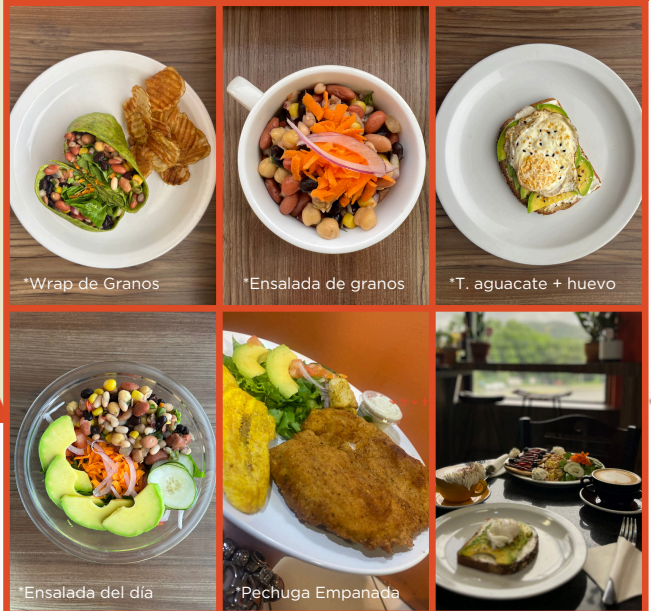
*Wrap de Granos

Tostada con aguacate, huevo y queso crema Termino "sunny side", "overeasy"